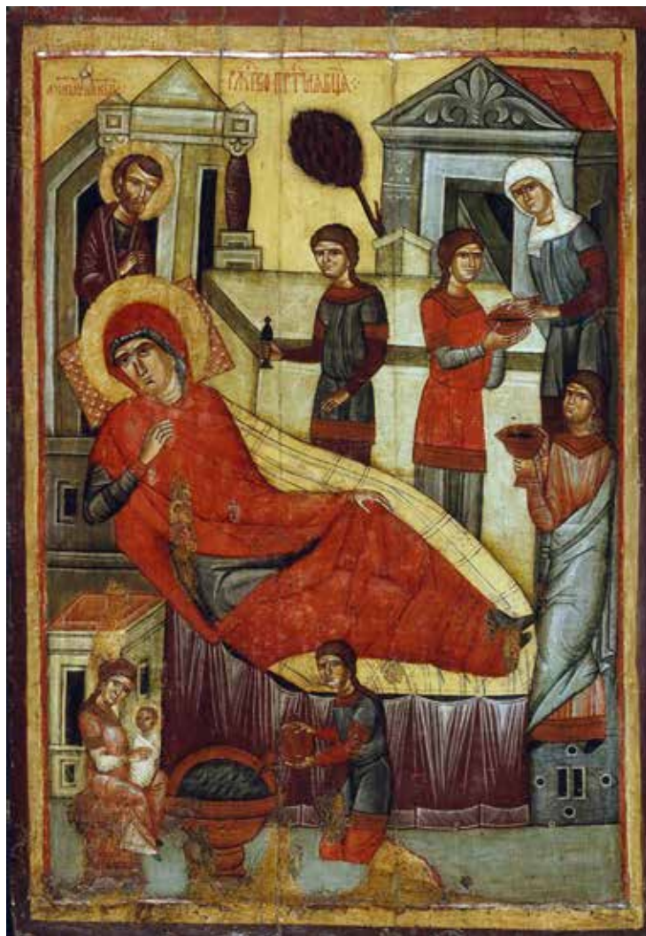
The Nativity of the Theotokos - Sep 21 (n.s) / Sep 8 (o.s.) Рождество Пресвятой Богородицы - 21 сент. (н.с.) / 8 сент. (церк.)