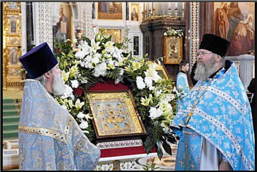
At Christ the Savior Church, Moscow