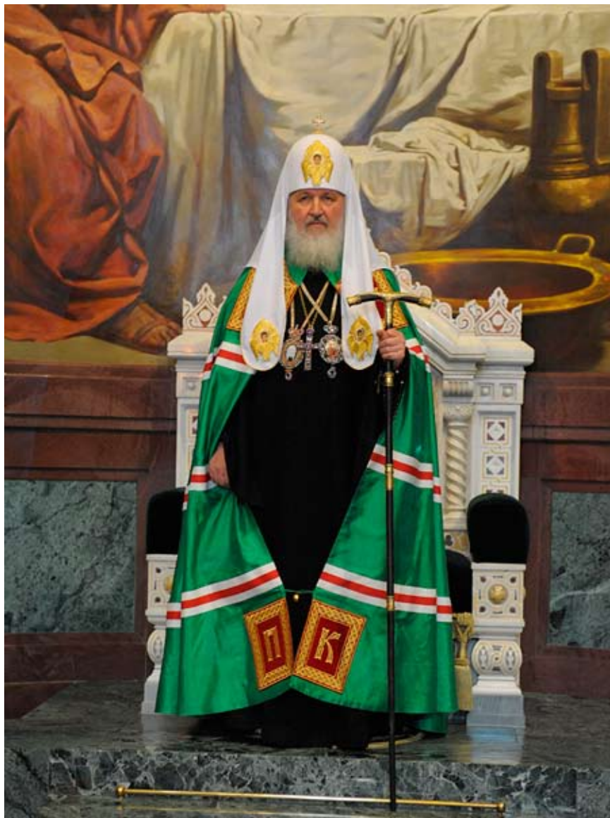
Kirill, Patriarch of Moscow and All Russia