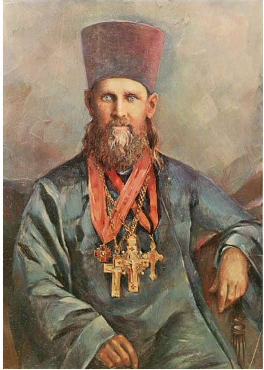
St. John of Kronstadt

If we make this effort, praying to Father John on our knees, “Father John, help us to approach thy holiness, even if only a little, a drop, by thy supplications warm our cold hearts, help us to commune with God, Who is Love and Life, perfect Goodness and Beauty.” If we